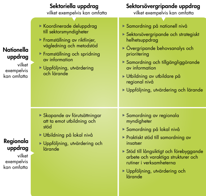
Figur 4. Exempel på fördelning av uppgifter utifrån fyra dimensioner av behov.